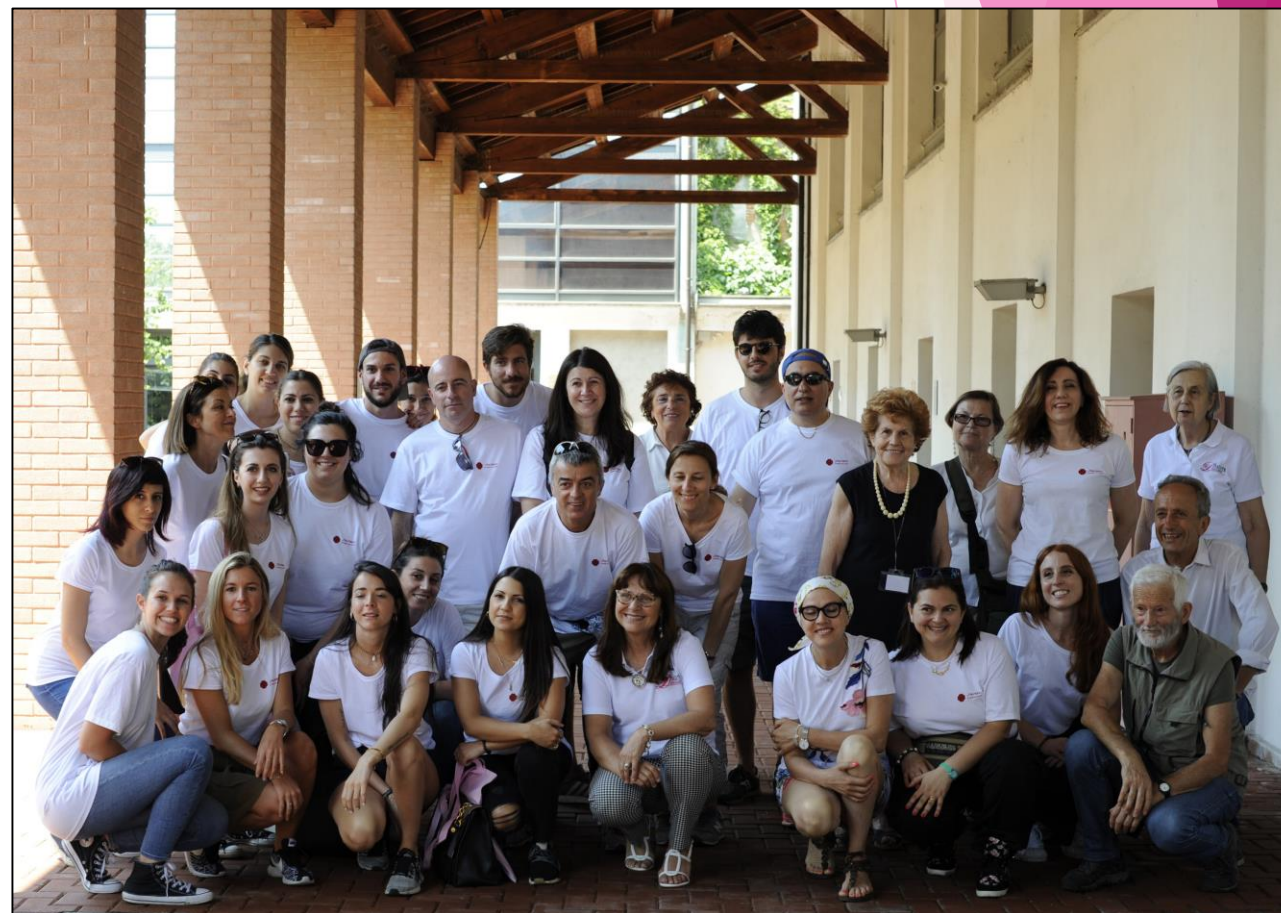
Charity Day, giornata di volontariato in Cascina Rosa e in Istituto Nazionale dei Tumori di Milano.