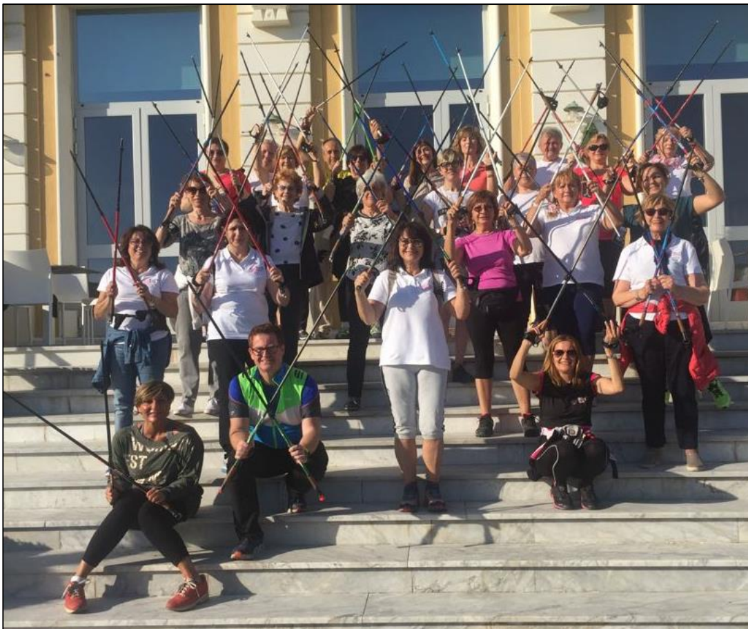
Marina di Massa, Corso di aggiornamento per Responsabili e Vice-responsabili Sezioni Nazionali